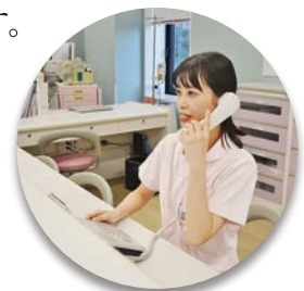
看護事務 入退院時の各所連絡や書類の管理などに関わります