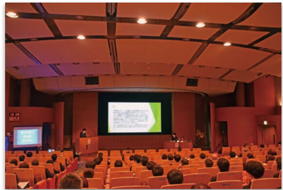
現地開催とオンライン配信を併用したハイブリッド開催