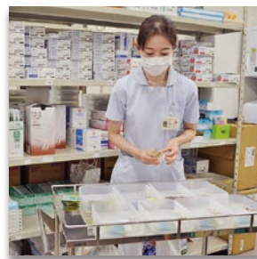
看護助手 各種物品の準備などを行っています