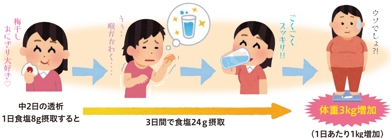
図：食塩と水の深い関係

上手に食塩を摂取して体重増加を適切に保ち、食事を楽しみながら透析ライフを過ごしましょう。