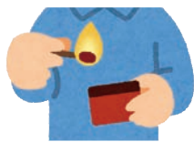
図1 マッチ棒をマッチ箱の横で擦ると、箱の赤リンが少しはがれてマッチの頭に付いて、まさつ熱で燃え出す

リンは岩や土に含まれるミネラルです。漢字では「燐」と書き、赤燐はマッチに使われ炎となります(図1)。英語ではフォスフォラス(phosphorus)といい、ギリシャ神話の「光を運ぶ者(フォスは光、フォラスは運ぶもの)」という言葉に由来しています。