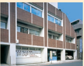
吉祥寺駅北口から徒歩3分です

診療時間 9:00~16:00 休診日 水曜・日曜 予約制 バスキュラーアクセス外来の診療は予約制となっております。ご来院前にお電話でお問い合わせください。(緊急を要する場合は別途ご相談ください。)