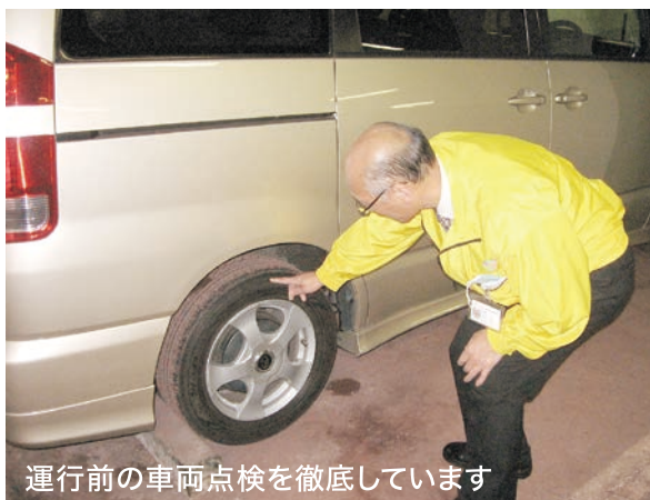
運行前の車両点検を徹底しています