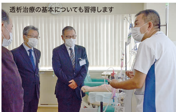
透析治療の基本についても習得します

がり、車両数は330台余り、ケアドライバー約450名で、何よりも安全を第一に日々途切れることなく運行を続けております。