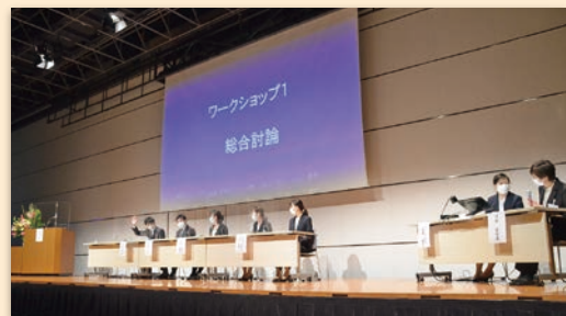
ワークショップ総合討論の様子。「ZOOM」を利用し、会場からオンライン配信を行いました。