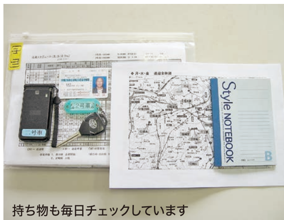
持ち物も毎日チェックしています