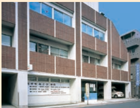
吉祥寺駅北口から徒歩3分です