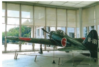
(左)靖国神社にて (下)自作プラモデルを ジオラマ撮影

結局、最後まで宮部が特攻へ志願した理由は明かされない。しかし生きることが当たり前になった今だからこそ、宮部が志願したその意味を考えてみてはいかがだろうか？