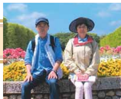
チューリップが彩る昭和記念公園にて

透析導入前の私の趣味は、旅行・乗馬・スキーでした。導入後は危険が伴うものは止め、旅行や温泉・公園めぐりを楽しむようになりました。