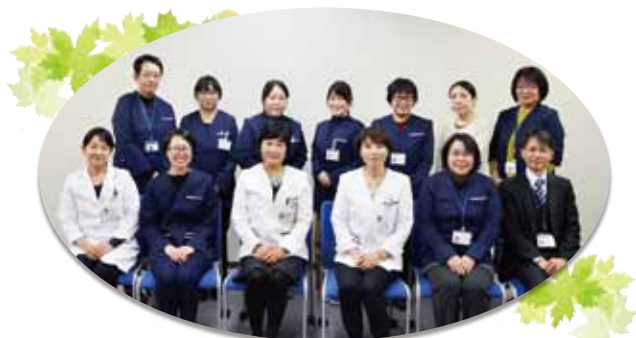
透析患者さまトータルサポート管理センター 一同

私どもは、できる限り患者さま・ご家族に寄り添いながら、地域の社会資源との連携や人との繋ぎ合わせのお手伝いをさせていただけるよう日々精進して参りますので、お気軽にご相談をいただければと願っております。