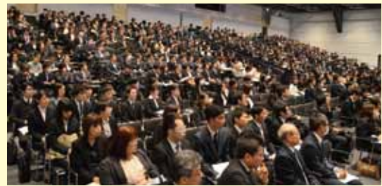
約700名の参加者が、各部門・各職種からの発表に耳を傾けました

研究報告会は、グループ全体の各部門、そして職種間の垣根を越えて各施設・各職種の課題などについて深く知ることができるとともに、日頃の研究成果や観点を発表することができる貴重な機会です。様々な職種が情報共有を行うチーム医療、そしてグループ全体の医療をより深い深度で共有し、高めていく意味でも、非常に意義のある会でもあります。総勢約700名が聴講・発表に参加し、会場からは発表者への質疑なども活発に行われていました。