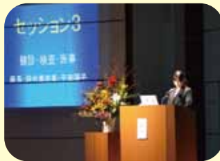
スタッフ研究発表の様子