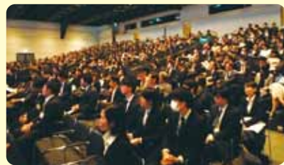
会場、聴講者の様子