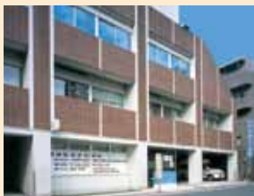
吉祥寺駅北口から徒歩3分です